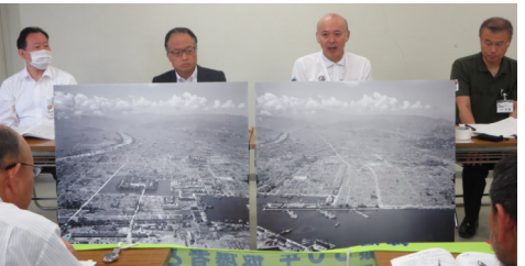
5/14今治市要請で紹介されたパネル