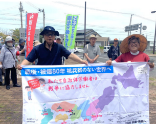
自治労連旗を香川へリレー