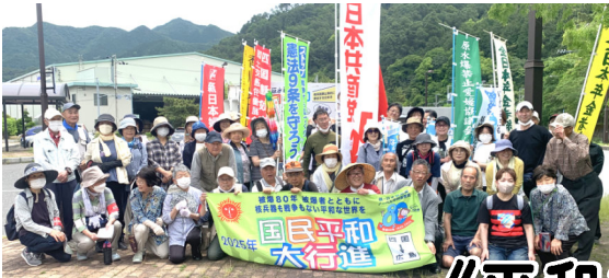
5/18香川へと引き継ぎ