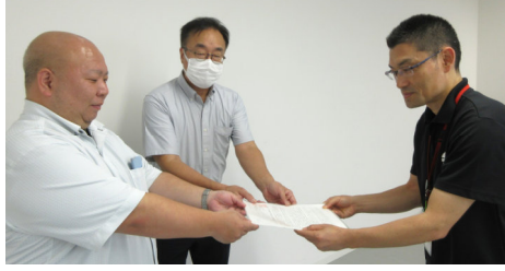
県内各単組で要求書を提出し要請

10月18日から県本部は「秋季年末統一要求書」を県内のすべての単組で提出し、当面の重点要求の改善の要請を行っています。賃金改善、職場での人員確保、休暇・両立支援、ハラスメント対策、 10月18日から県本部は「秋季年末統一要求書」を県内のすべての単組で提出し、当面の重点要求の改善の要請を行っています。賃金改善、職場での人員確保、休暇・両立支援、ハラスメント対策、