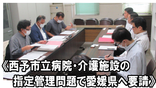
《西予市立病院・介護施設の指定管理問題で愛媛県へ要請》

るとりくみの強化に言及し、またカスターマールラスメントへの対応が重視され、組織的対応も求められているなどにも言及。ハラスメントの無い職場づくりを求める。 ⑤定年延長・再任用 ◇給与一律7割支給の見直しを。役職定年もなく、60歳以後も仕事内容も同じにも関わらず、給与7割となることの不合理性の是正を(「60歳を超えての働き方アンケート(愛媛県本部実施)」に 寄せられた声を伝え、改善を求める)。 ⑥非正規・公務員職場(を含む)、休暇制度について、正規職員と同等にすることを。 ◇雇用の更新回数制限を撤廃すること(人事院通知「期間業務職員の適切な採用について」の1部改正)で、更新は2回まで、3回目は公募としていたが、これを国家公務員の期間業務職員(非正規職員)については撤 廃、総務省も会計年度任用職員制度のマニュアル例示から削除したため、国の対応を踏まえて自治体も対応を。 ◇指定管理職場の労働者の賃金・労働条件改善(「公務サービス基本法」第11条による労働条件への配慮を前提とした指定管理者の選定求める)。 ⑦労使関係・組合交渉 ◇適切な労使関係の構築と誠実な回答、労働条件変更は労使合意を原則、対等な団体交渉を。