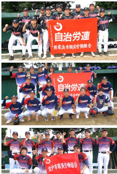
【四国ブロック野球大会】