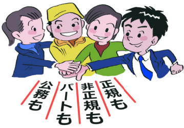
正規も 非正規も パートも 公務も