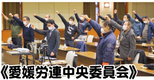
《愛媛労連中央委員会》