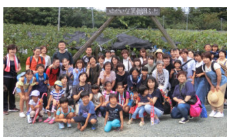
カッターが「いいね」の声もあり、女性部に期待が集中しました。

ちも大喜び。取ったぶどうは食べ切りで、子ども連れのお母さんが食べるのに大変な様子も。どのぶどうも美味しく、「お土産ぶどう」を購入した家族から「帰りに寄った道の駅より安かった」の声もあり、お得で美味しいぶどう狩りに大満足。「来年は『シャインマスカット』がいいね」の声もあり、女性部に期待が集中しました。