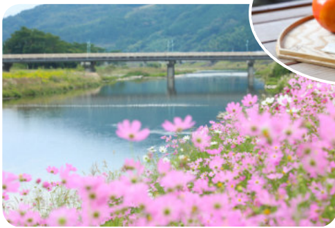
内子町／小田深山、御祓地区の田んぼ、大瀬の柿、豊秋橋とコスモス畑